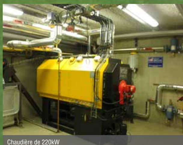
Chaudière de 220kW

En se chauffant avec du bois local, les communes financent des emplois locaux.