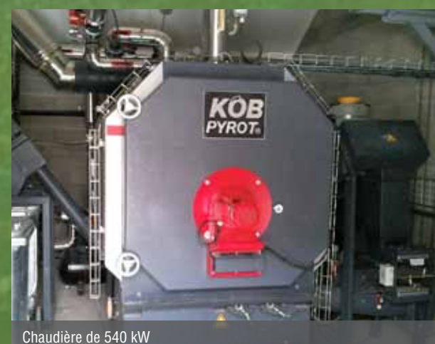
Chaudière de 540 kW