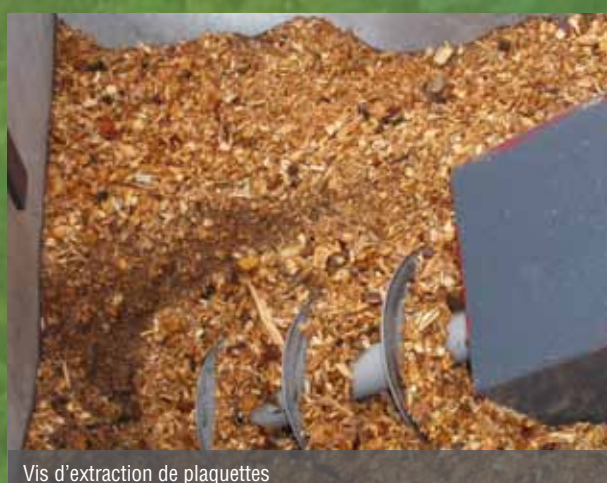
Vis d'extraction de plaquettes