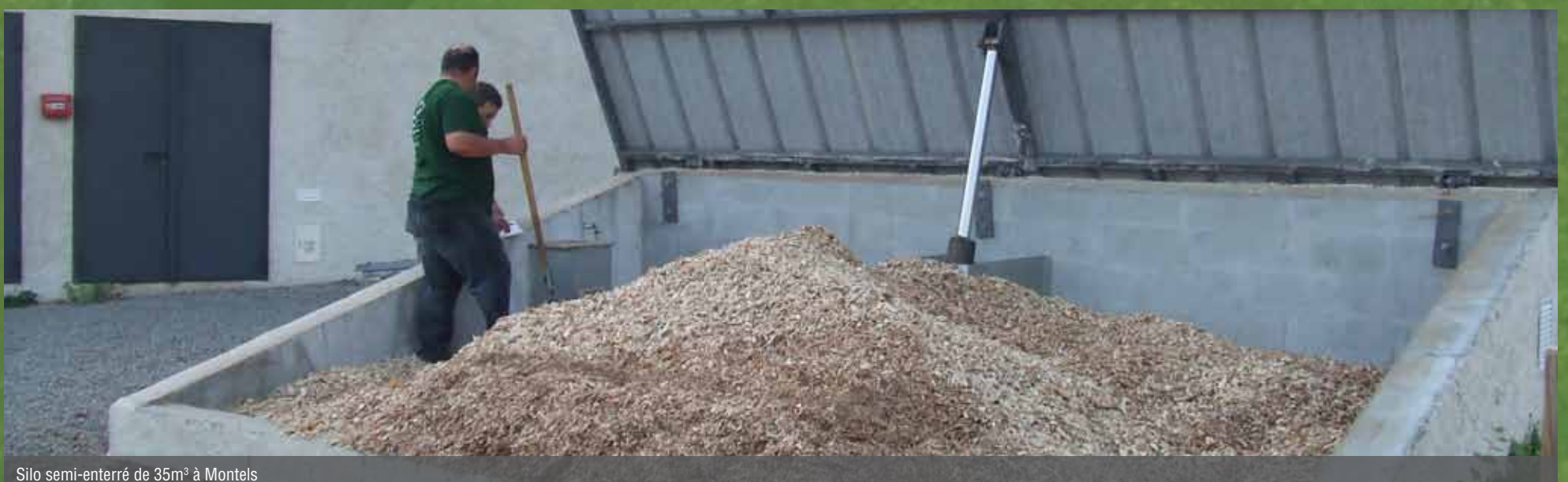
Silo semi-enterré de 35m³ à Montels