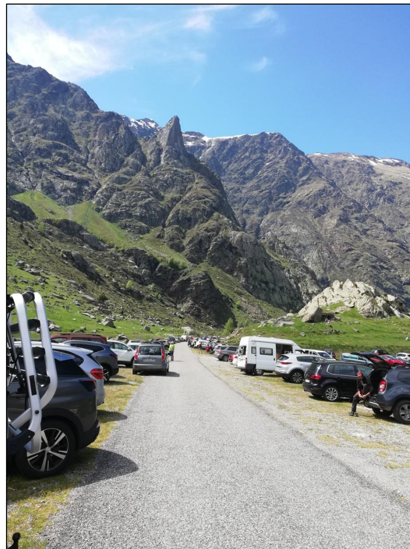
Parking de l'Etang de Soulcem, 2020.

Les documents d'Objectifs des sites Natura 2000 de l'Isard et du Valier, actuellement en cours de révision, mentionnent le besoin de définir des « zones de quiétude » . Ces zones, concertées avec les gestionnaires et les pratiquants, viseront à canaliser les activités humaines et réduire les nuisances , afin de constituer des refuges pour la biodiversité. Les espèces cibles de ces actions sont le Grand Tétrás, les grands rapaces comme le Gypaète barbu ou l'Aigle royal, le Desman des Pyrénées . Notons enfin que la biodiversité sonore commence à faire l'objet d'études de plus en plus poussées, et constitue un outil de suivi pertinent pour mesurer l'évolution des écosystèmes. Cependant peu de données sont aujourd'hui disponibles sur ce sujet.